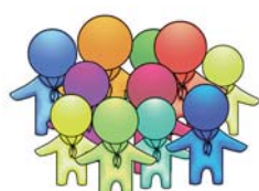
Pfadfinderarbeit in Diözesanverbänden