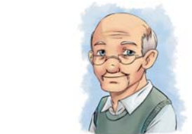
Opa spendet zusätzlich