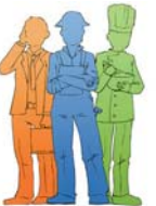
Firmen und Ehemalige spenden zusätzlich