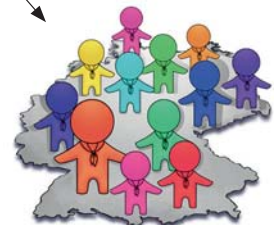
Pfadfinderarbeit im Bundesverband