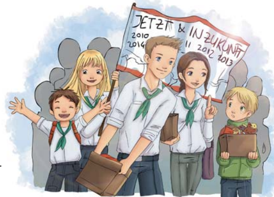
Pfadfinderarbeit Jetzt und in Zukunft

Zinsen sind der Preis von Geld. ... Zinsen. Genau genommen ist es der Preis, den jemand zahlen muss, der sich Geld leiht. Andersherum geht das natürlich auch: Jemand verleiht Geld. Legen wir also unser Geld bei der Bank an, zahlt die Bank uns dafür Zinsen. Genau das machen Stiftungen. Sie sammeln Geld und die Bank packt Jahr für Jahr Zinsen drauf.