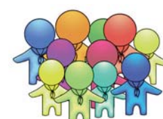
Pfadfinderarbeit in Diözesanverbänden